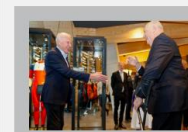
Kongen åpnet det nye

Men noen ganger kan tilbyder se seg tjent med å la være å spørre. Det kan være hensiktsmessig hvis man for eksempel