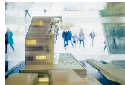
KRAV TIL BYGGVERKET